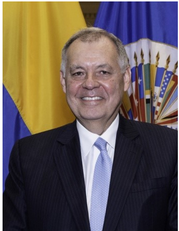
In der Kritik: Alejandro Ordóñez aus Kolumbien

In seiner Zeit als Generalstaatsanwalt hatte sich Ordoñez einen Namen als religiöser Kämpfer für ein traditionelles Familienmodell, gegen die Gleichstellung von LGBTI-Personen und erklärter Gegner