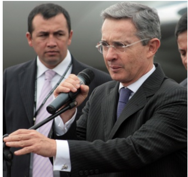
Der Ex-Präsident von Kolumbien und aktuelle Senator von der ultrarechten Partei Centro Democrático, Álvaro Uribe