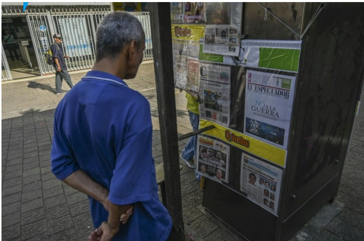
Zeitungen nach der Ankündigung von Ex-Farc-Anführern, wieder zu den Waffen zu greifen

Per 24matins.de mit AFP, veröffentlicht am 30 August 2019 um 21h30.